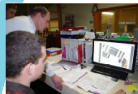
Le Bureau d'Etudes